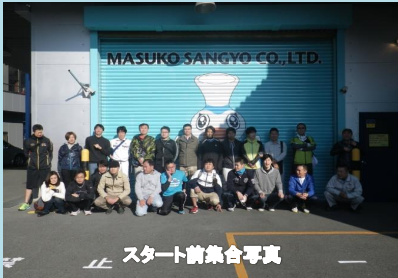
スタート前集合写真